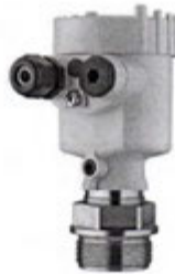
Рисунок 12 - Внешний вид преобразователя давления VEGABAR 82