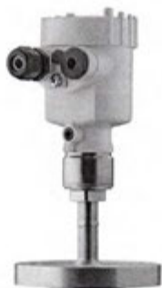
Рисунок 3 - Внешний вид преобразователя давления VEGABAR 51