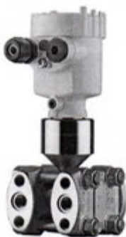
Рисунок 10 - Внешний вид преобразователя давления VEGADIF 65