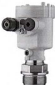
Рисунок 4 - Внешний вид преобразователя давления VEGABAR 52