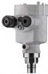
Рисунок 6 - Внешний вид преобразователя давления VEGABAR 54