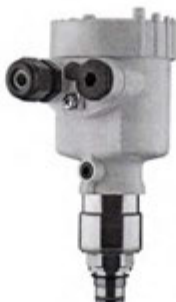
Рисунок 5 - Внешний вид преобразователя давления VEGABAR 53