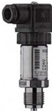
Рисунок 2 - Внешний вид преобразователя давления VEGABAR 17