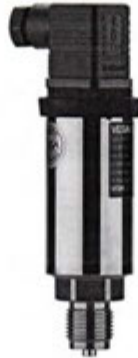
Рисунок 1 - Внешний вид преобразователя давления VEGABAR 14

Внешний вид преобразователей давления приведен на рисунках 1-15.