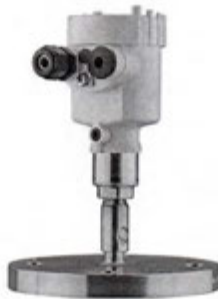
Рисунок 11 - Внешний вид преобразователя давления VEGABAR 81