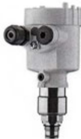
Рисунок 13 - Внешний вид преобразователя давления VEGABAR 83