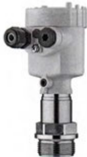
Рисунок 7 - Внешний вид преобразователя давления VEGABAR 55